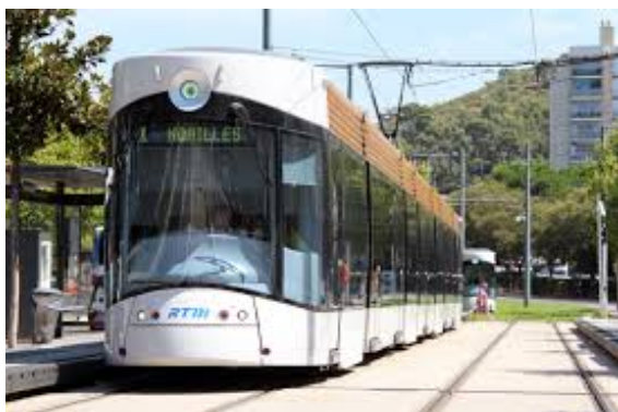
<< Le tram de Marseille

- Enquête de satisfaction sur le réseau à Marseille: 97% des usagers satisfaits du tramway.